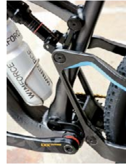
Konstruktiver Leckerbissen der Stoll-Bikes ist der antriebsneutrale, virtuelle Drehpunkt der Hinterradschwinge. Schön ist das Sicht-Carbon und die unsichtbare Kabelführung im Rahmen.

Wir haben die erste Anhöhe am Wannenberg zwischen Osterfingen und Neuhausen erreicht. «Nun kommt ein flowiger Singletrail», instruiert Stoll und prescht in den Wald am Lauferberg. Nur wenige Reifenbreiten ist der mäandernde Weg breit und wunderbar flowig. Das T1 liegt satt in der Spur, die Federung bügelt alle Unebenheiten weg. Im Handumdrehen haben wir Neuhausen erreicht. Stoll fährt durch die Quartiere zielstrebig an den Rhein. Ein voller Parkplatz kündigt an, dass heute viel Betrieb am Rheinfall ist. Wir wechseln deshalb zunächst die Fluss-Seite, damit wir unsere Bikes nicht zur nationalen Sehenswürdigkeit schieben müssen – und schaffen es dann sogar, auf einer der vielen Plattformen ein Foto mit Stoll und Wasserfall zu schiessen. Der interessante Teil der Tour kommt jetzt: Vom Rheinfall fahren wir den Ufer-Trail bis Rheinau. Acht Kilometer in stetem Auf und Ab mit unzähligen Richtungswechseln. Erstmals kann die neue Sram-Eagle-12-Gangschaltung ihre Stärke ausspielen. Keine Steigung weist mehr als 25 Höhenmeter auf, meist sind es bloss 10 bis 12. Doch die