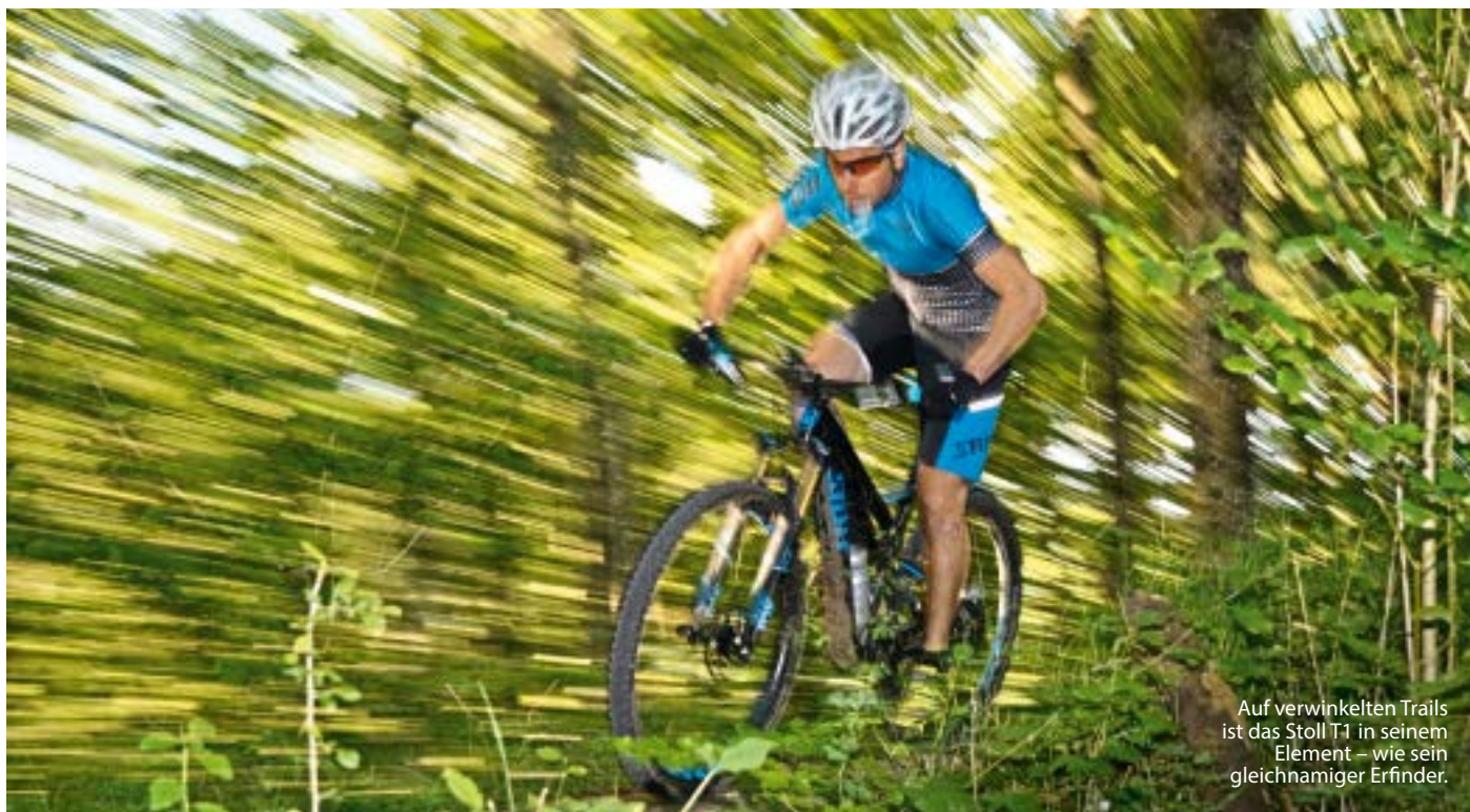
Auf verwinkelten Trails ist das Stoll T1 in seinem Element – wie sein gleichnamiger Erfinder.

sind ruppig. Schaltung, Bremsen, Reifen und natürlich die Geometrie des Bikes müssen nun perfekt zusammenspielen, sonst macht es keinen Spass.